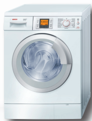
Waschmaschinen: WAS32741CH WAS28741CH WAS24741CH